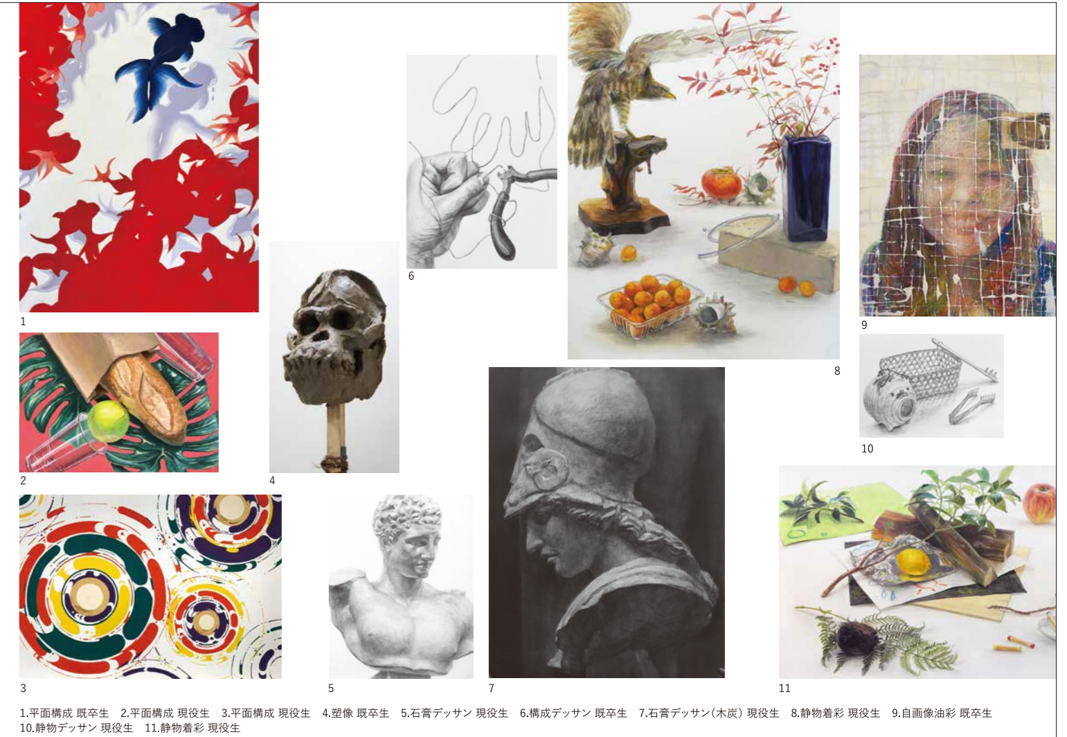
1.平面構成 既卒生 2.平面構成 現役生 3.平面構成 現役生 4.塑像 既卒生 5.石膏デッサン 現役生 6.構成デッサン 既卒生 7.石膏デッサン(木炭) 現役生 8.動物着彩 現役生 9.自画像油彩 既卒生 10.静物デッサン 現役生 11.静物着彩 現役生

美術を職業にするために 美術を職業にするために、今こそ十分な基礎力を身につけたい... そんな「本物の力」を身につけたいと願っている人に少人数クラスでの徹底した個別指導で、豊かな造形意識を育みながら、志望校への合格を目指します。