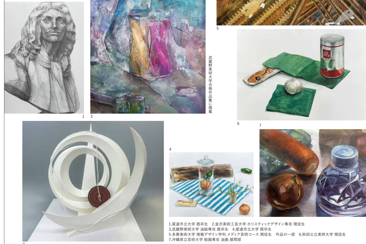
1.尾道市立大学 既卒生 2.金沢美術工芸大学 ホリスティックデザイン専攻 現役生 3.筑波野美術大学 油絵専攻 既卒生 4.尾道市立大学 既卒生 5.多摩美術大学 情報デザイン学科 メディア芸術コース 現役生 作品の一部 6.秋田公立美術大学 現役生 7.沖縄県立芸術大学 絵画専攻 油画 夏間部