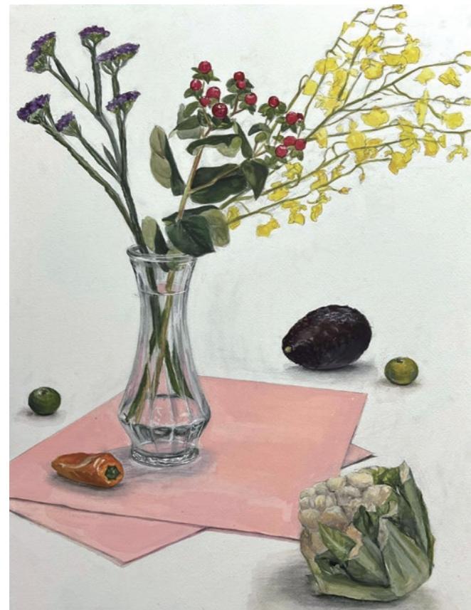
尾道市立大学2025年度学校推薦型入試合格作品